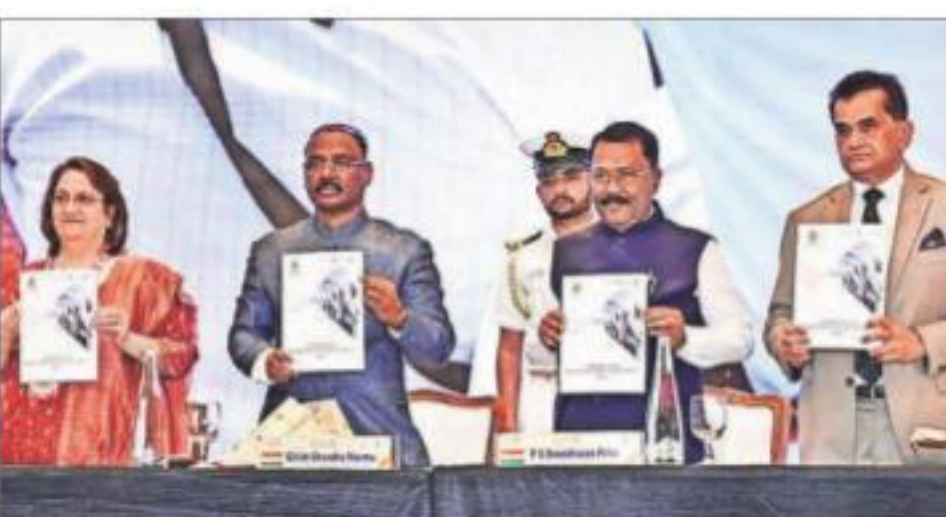
Goa governor PS Sreedharan Pillai with CAG GC Murmu, G20 Sherpa Amitabh Kant and another dignitary on Monday.

“At an individual layman level, ChatGPT compelled us to recognise it and also triggered the debate of its utility vis-a-vis its risks, especially if recklessly used by young students. This combined with a spate of statements by the very developers in the field, concernedly commenting on its considerable carbon footprints, risks, ethicality and challenges, underscores the need for Responsible AI,”