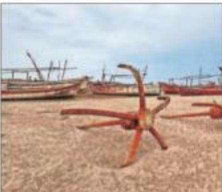
Fishing boats anchored at Mandvi in Kutch district of Gujarat on Monday

Meanwhile, the media statement on cyclone preparedness by Adani Ports said: “All actions, in line with our Disaster Management Plan and SOPs thereof at Dighi, Hazira, Dahej, Mundra, and Tuna terminal, have been initiated. The SOPs are all-encompassing covering people safety, vessel safety, equipment safety, backup yard safety, vehicle & Railway safety as well as storm water drainage, etc.” The statement further said that the stock