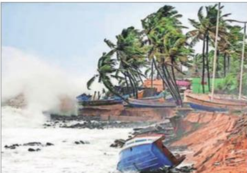
Multiple ports in Gujrata were also shut down, including Kandla, the country’s largest port

In Rajkot, Varsha Bavaliya, a resident of Chhasiya village, was killed and husband Bhavesh was seriously injured after a tree fell on them while they were going